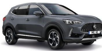
MAGIC siva (kovinska)