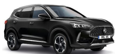
PEBBLE črna (kovinska)