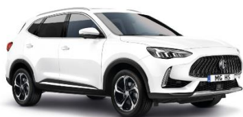
DOVER bela (enoslojna)