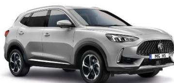
MEDAL srebrna (kovinska)