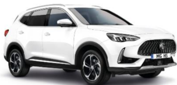
DOVER bela (enoslojna)