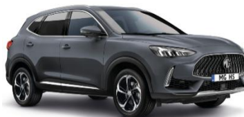
MAGIC siva (kovinska)