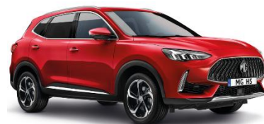
DIAMOND rdeča (kovinska)