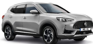
MEDAL srebrna (kovinska)