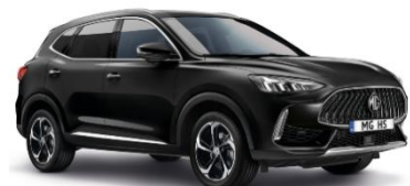
PEBBLE črna (kovinska)