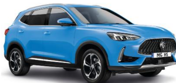
BRIGHTON modra (enoslojna)